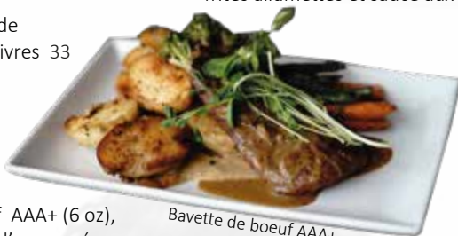
Bavette de boeuf AAA+

Haut de surlonge AA+ (9 oz), servi avec frites allumettes et sauce aux poivres 29