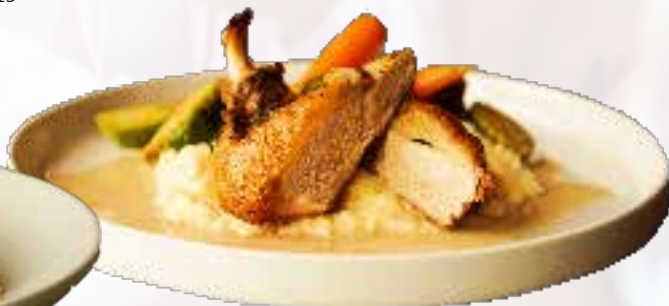
Suprême de pintade

Suprême de pintade de la Pintade (Princeville) grillé à point, accompagné d'un risotto au cheddar, de légumes du moment et d'une sauce aux champignons 28